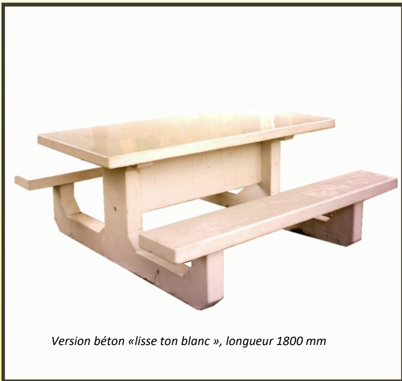
Version béton «lisse ton blanc», longueur 1800 mm